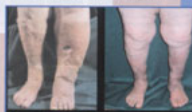
Figura 4 Linfedema primario tardivo

- Controllo evolutivo della riduzione del linfedema dell'arto inferiore (gruppo 3) sottoposto al modello multistrato contenitivo-compressivo composto da: ossido di zinco-Cumarina + benda di garza + benda ad elevato allungamento, bielastica con controlli alle 2 ore, una settimana e settimane successive.