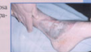
Figura 2 Mappatura perimetrale dell'ulcera su filmina quadriculata