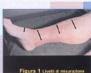
Figura 1 Livelli di misurazione

- Dopo avere consegnato i dati base si è confezionato un primo strato di bendaggio con una benda all'ossido di zinco +Cumarina (con tecnica di due spire regolari ascendenti,