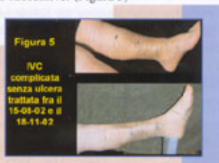
Figura 5 IVC complicata senza ulcera trattata fra il 15-09-02 e il 18-11-02

modello multistrato composto da: ossido di zinco-Cumarina + benda di garza + benda ad elevato allungamento, bielastica e l'arto destro con il modello multistrato composto da: ossido di zinco - s e n z a Cumarina + benda di garza + benda ad elevato allungamento, bielastica con controlli alle 2 ore, una settimana e due settimane.